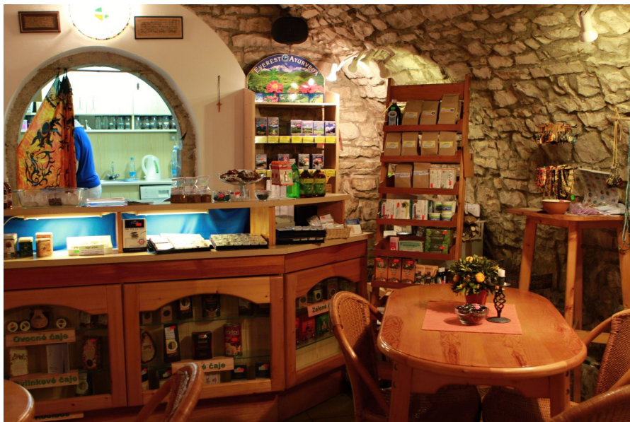
Interiér čajovny U svatého Mikuláše