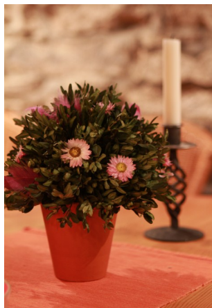
Interiér naší čajovny, E.F.